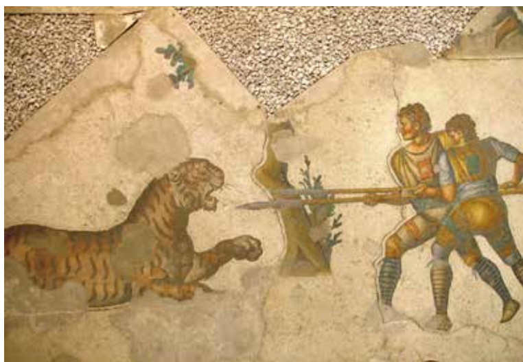
בתחרויות הקרקס הרומאי הופיעו גלדיאטורים לחיים ולמוות מול יריבים – בני אדם או חיות טרף

לסיכום, ניתן לומר כי הרומאים, שירשו מן היוונים את עולם תרבות הגוף, ביזו את ערכי הספורט ביזוי מוחלט, בהופכם אותו לקרקס קטלני לצורך שליטה בהמון במסגרת אסטרטגיית ה"לחם ושעשועים" שלהם. בד בבד, הם ניהלו מערכת של חינוך גופני ללא שאר רוח מיוחד וללא כוונת חינוכיות מקיפות, שתכליתה היחידה הייתה אספקה שוטפת של כוח לוחם, מיומן וממושמע, לגייסות הצבא. חינוך גופני זה היה מנותק לגמרי מעולם הספורט, שהעסיק בכפייה בעיקר אנשים לא חופשיים, שלא זכו כלל להתחנך במסגרת של מערכת החינוך הרומאית.