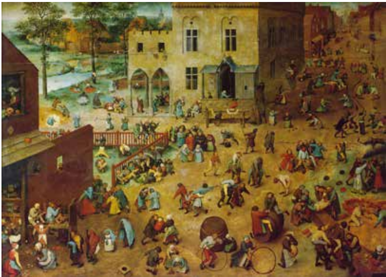
משחקי ילדים. הצייר: פטר ברויגל

מאליו יובן כי תשובה לדילמה זו נעוצה בטיב הבנתנו את המהות האנושית ובהסבר שאנו מספקים להבנה זו. כאן אפשר היה פשוט