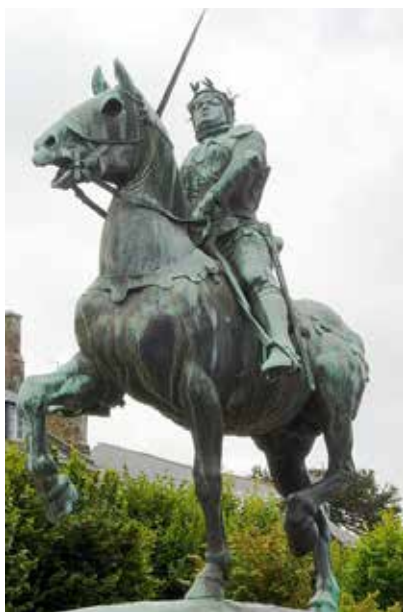
האביר הצרפתי ברנרד דה-גווסלין

התחרות המרכזית בטורניר הייתה דו-קרב בין שני פרשים נושאי רמחים ארוכים מעץ, שנעו פנים מול פנים בדהרה (הדהרה לא הייתה מהירה מדי מפאת המשקל הרב שהסוסים נאלצו לשאת על גבם) לתכלית של פגיעה והפלה. בין המתמודדים הפרידה בדרך כלל גדר עץ כדי להגן על גופו של הסוס ומאוחר יותר גם כדי למנוע פגיעה מתחת לחגורת הספורטאי. מעניין כי בשונה